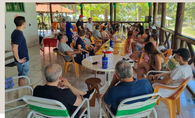
Salão de festas com capacidade para 300 pessoas.