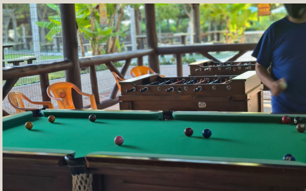
Salão de jogos mesas Ping Pong, mesas de Sinuca, Mesas de Pebolim, Cancha de bocha.