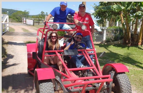
Passeios de buggy pelas dependências do sítio.