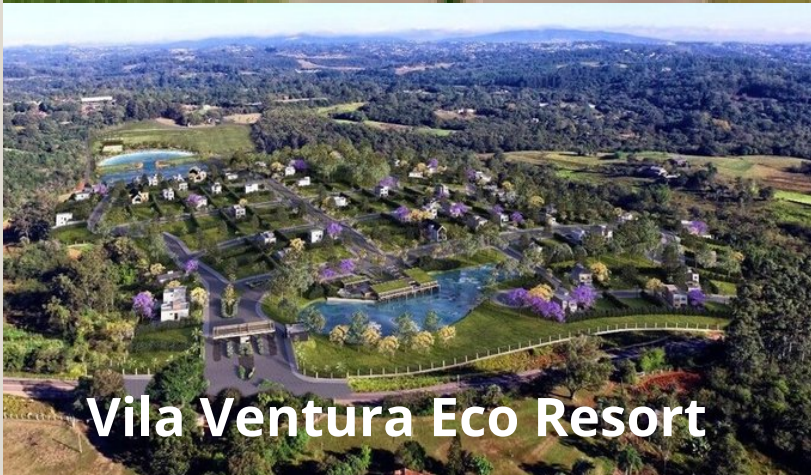
Vila Ventura Eco Resort