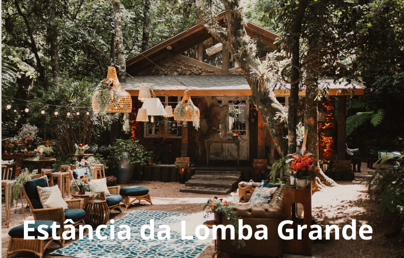
Estância da Lomba Grande

Estalagem Pastoreio, espaço para eventos, restaurante e hospedagem, estadia em torno de R$ 500,00 (por pessoa). Está sendo lançado o condomínio Vila Ventura Eco Resort com terrenos em torno de R$ 350.000,00 lote de 477m 2 .